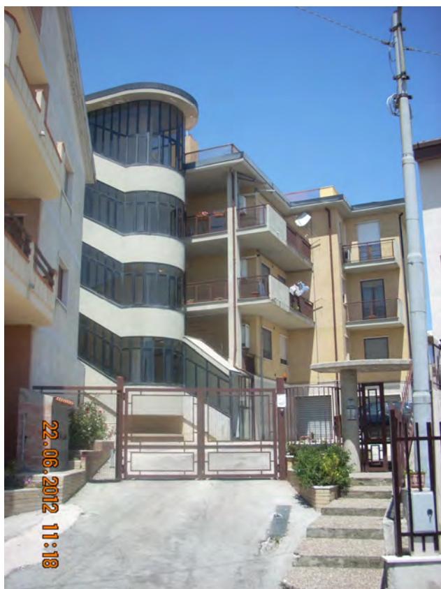
Foto 1 : INGRESSO AL CORTILE CONDOMINIALE (dalla Strada Provinciale per Lucera)