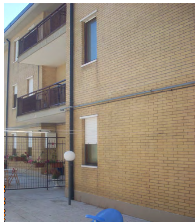
Foto 13-14-15-16-17 : TERRAZZO A LIVELLO